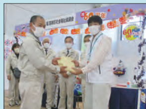
榛東村農業委員会 (R4.10.23)

〒124-0006 葛飾区堀切3-34-1 地域福祉・障害者センター (ウェルピアかつしか内)