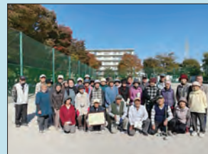
グラウンドゴルフ サンサンクラブ (R4.11.4)