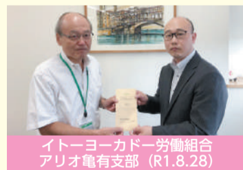
イトーヨーカドー労働組合 アリオ亀有支部 (R1.8.28)