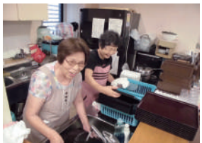
お皿洗いの活動をするサポーターさん