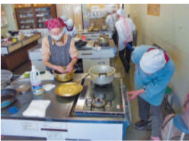
前回の調理の様子