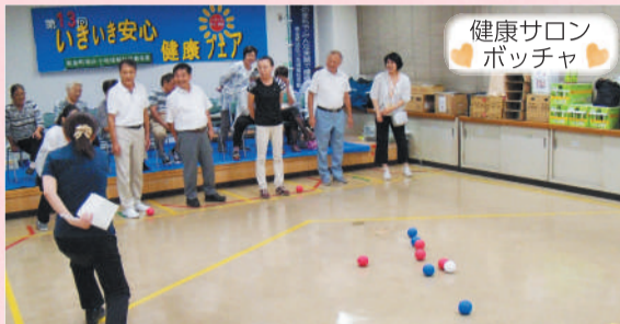
健康サロン ポッチャ

月2回、健康づくり推進員の協力のもと、初心者でも気軽に参加できる「簡単ヨガ」「ポッチャ」「スポーツダーツ」「スポーツ吹き矢」を実施しています。活動終了後、ミニ茶話会を行い、更に交流を深めています。時間はいずれも午後1時30分～3時。場所は東金町地区センター(東金町5-33-6)です。