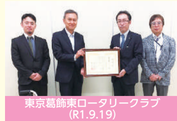
東京葛飾東ロータリークラブ (R1.9.19)