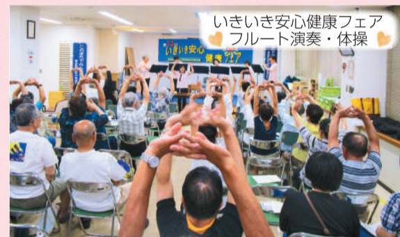
いきいき安心健康フェア フルーツ演奏・体操

年に1回、防犯・防災や健康・生きがいづくりに関心をもってもらうためのイベントを開催しています。今年度は9月14日(土)に開催し、健康をテーマに講演会や体力測定を行いました。