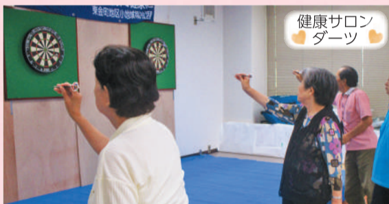
健康サロン ダーツ