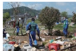
災害ボランティアによる瓦礫の撤去

葛飾区においても、被災時に速やかな支援活動ができるよう、「災害ボランティア」の登録を受け付けています。