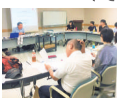
前回の講座の様子