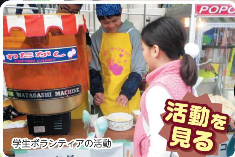
学生ボランティアの活動