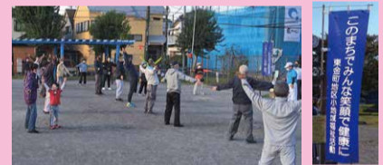
ラジオ体操(東金町地区)

地域が抱えるさまざまな生活課題を解決するため、地域の皆さんと一緒に活動を進めていきます。