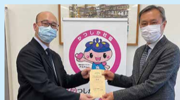
イトーヨーカドー労働組合亀有支部(3.3.3)