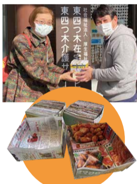
コロナ禍でも、自宅でできる「ゴミ箱作り」を通してサポーター活動を行っています。