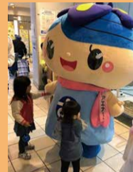
ボランティアまつり

新たにSNSを活用することで、社協の役割や全事業の取り組みについて情報発信します。また、福祉の担い手や会員増強につなげていきます。