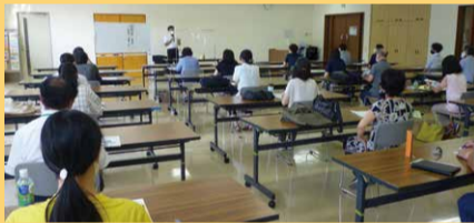
成年後見制度 講演会

成年後見制度を広く区民に知っていただくように広報・普及活動を幅広く実施するとともに、地域の関係機関とのネットワークを通じて、対象者の早期発見と円滑な利用促進を図っていきます。