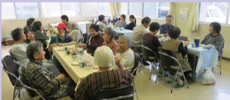
地域の居場所「サロン」(イメージ)

令和2年度には、遺言による多額な寄付を含め、1億円近い寄付が寄せられました。新たに「地域支えあい基金」を設置し、地域の皆さんによる支えあい事業(居場所づくりなど)を中心に活用していきます。