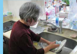
しあわせサービス

支援を必要としている人、支援をしたい人を確実に繋げていくことで、地域で誰もが安心して暮らせる仕組みづくりを積極的に進めていきます。