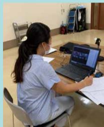
オンラインを活用した相談事業

ボランティア活動に興味を持つきっかけづくりとして、オンラインを活用した取り組みを進めます。