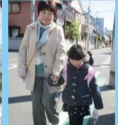
ファミリー・サポート・センター