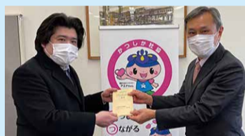
イトーヨーカドー労働組合亀有駅前支部(3.3.1)