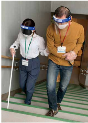
「アイマスク・ガイドヘルプの体験中」