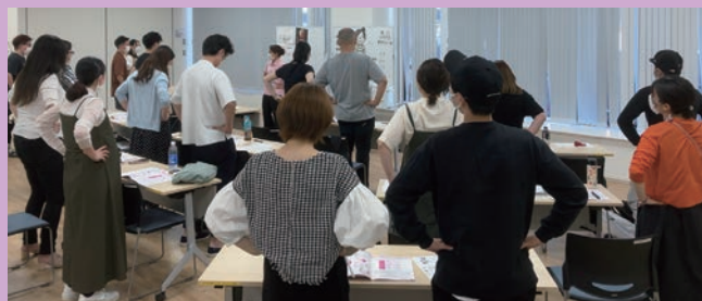
多くの方が参加するパパママ学級♪

2013年に区内で活動していた助産師を中心としたメンバーで設立されたのが「さんばはうす葛飾」です。私自身、子育て中の時に不安がたくさんあり、気軽に相談できる人が地域にいてくれたらと思っていました。そう思っているうちに私がそういう存在になりたいと思うようになっていたことも、設立を考えた一つのきっかけです。