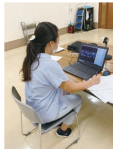
オンラインで相談

専門相談員(弁護士・社会保険労務士・税理士・司法書士)による相談を受け付けています。(費用は無料) ボランティア活動やNPO、地域貢献活動に関するお困り事の解決にお役立てください。