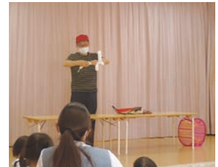
さん・サンひろば での一コマ