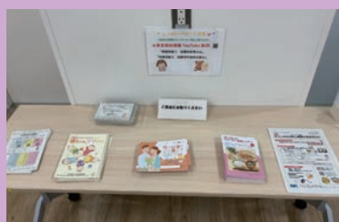
妊娠に関する資料もたくさんあります

わからないから相談しない、ネットの情報だけを頼りにするなど、妊婦さんが孤立してしまうこともあります。妊婦さんによって合う場所や合わない場所がありますので、一人一人に寄り添い個別に相談先や支援先を案内してあげることができれば、孤立する人は減ると思います。