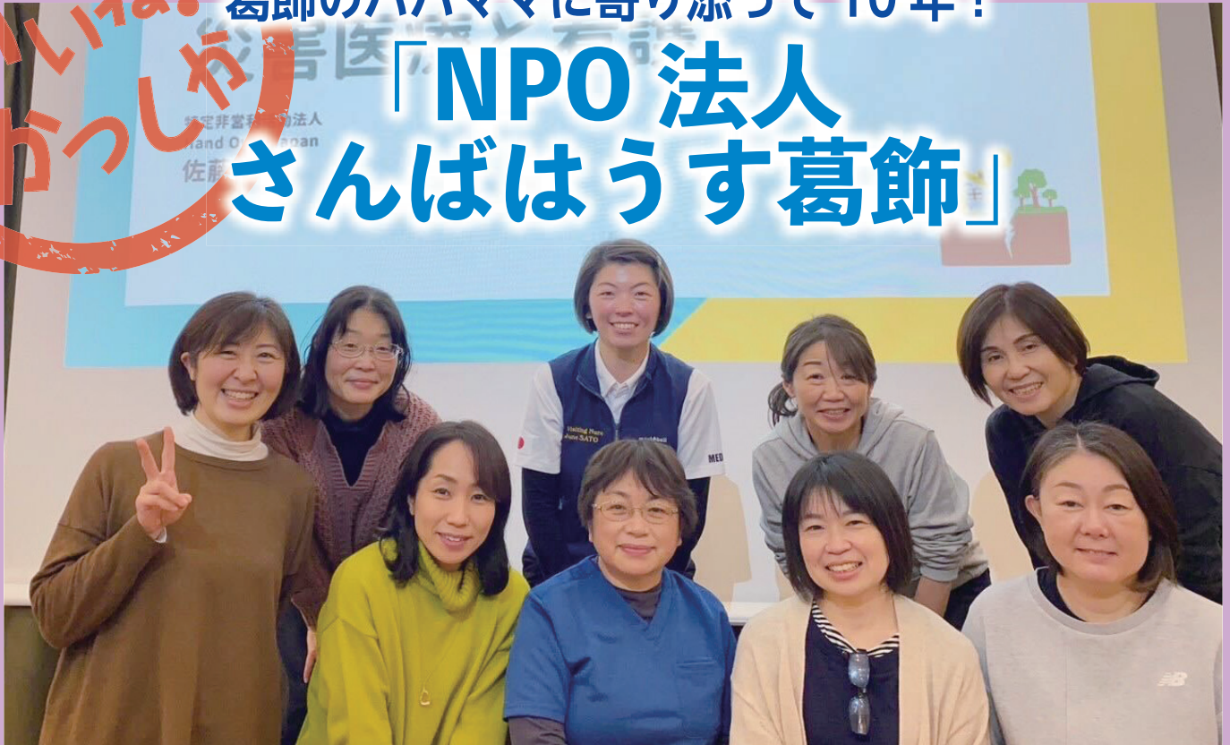
「さんばはうす葛飾」と「Hand Over Japan」が協働で研修しました！