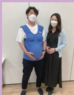
妊婦体験もできます！