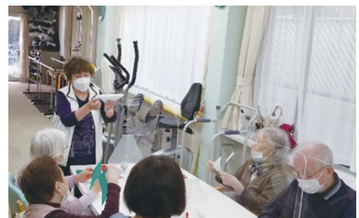
施設で折り紙を教えています