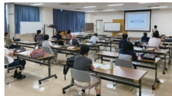
座学やワークで災害について学びます