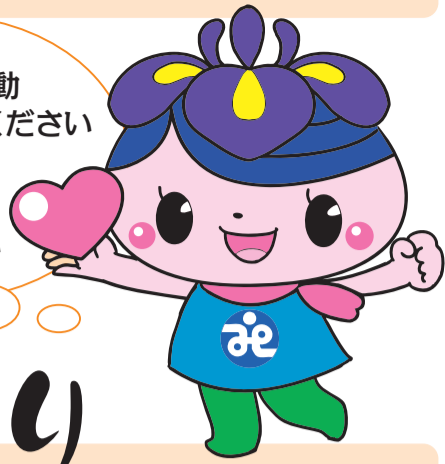
社協キャラクターのアエナちゃんです!