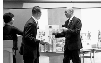
葛飾カラオケ友の会 (28.4.3)