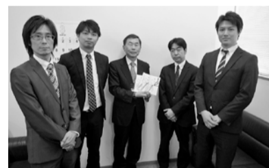
ドコモショップ 亀有店 金町駅前店 アリオ亀有店 スマホショップ 綾瀬駅前店 (28.3.31)