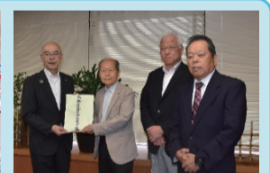
葛飾区観光協会鎌倉支部 (R6.5.31)