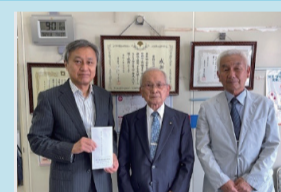
東立石さくらまつり実行委員会 (R6.5.24)