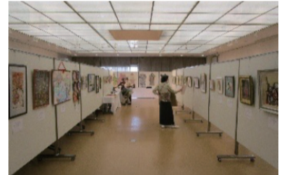
昨年度のアートフェアの様子