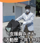
支援員Aさん 活動歴 2年1か月

初めての支援では不安な気持ちになりましたが、回を重ねていくうちに業務に慣れてきました。活動をしていく中でたくさんのお出会いがあり、知識を増やすために様々な講習を受講し前向きに取り組んでいます。