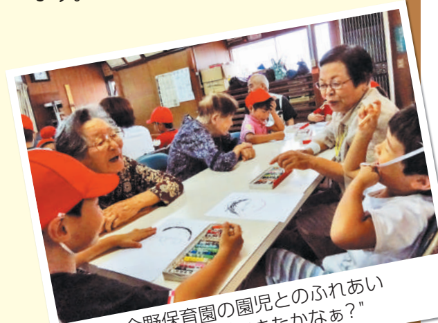
会野保育園の園児とのふれあい “似顔絵ができたかなあ?”