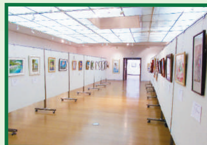
(絵画・書・手芸・編み物・工芸品など、今回も色彩豊かに飾られました。)