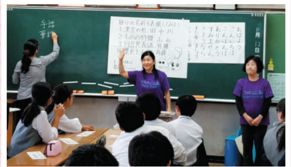
福祉ボランティア出前講座の様子

聴こえる人も聴こえない人もお互いの理解を深めることで、支えあい・助けあいながら暮らしていけるような“まち”にしていきたいです。