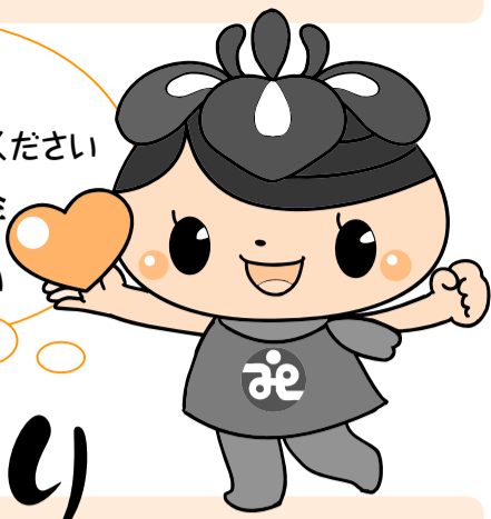
社協キャラクターのアエナちゃんです!

アエナが行く!! …2面をご覧ください 赤い羽根共同募金 …3面を ご覧ください