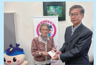
立石宮元クラブグラウンドゴルフ部 (R5.10.12)