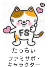
たっちゃん ファミサポ キャラクター