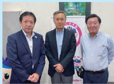
東京都美容生活衛生同業組合 葛飾北支部 (R5.9.25)