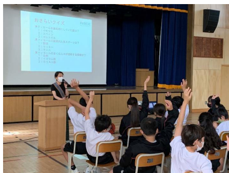
[本田中学校：国際協力、国際理解について]