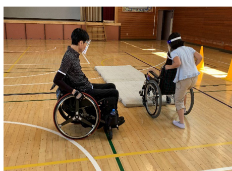
[小松南小学校：車いす体験]