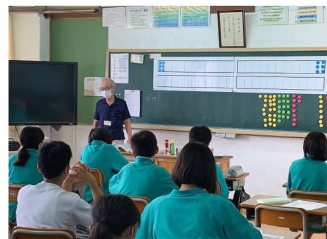
[中川中学校：点字（点訳）体験]