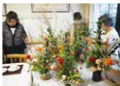
フラワーアレンジメント講座