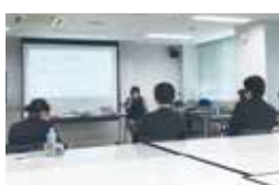
先輩を招いた出前講座