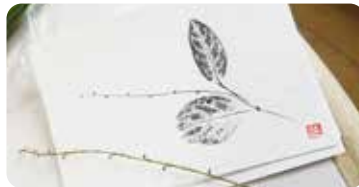
湿拓:葉などに墨をつけ、紙に摺(す)り取ります