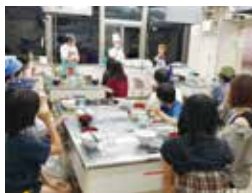
コロナ前は子ども食堂で料理を提供して交流