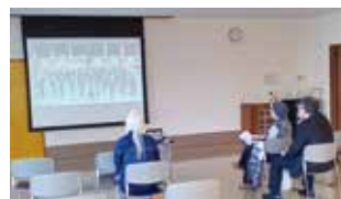
特設サイトの上映会