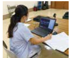
オンラインで相談