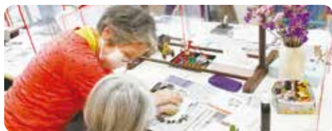
利用者に湿拓を教えました