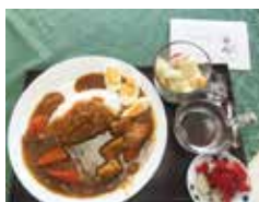
お手製のポークカレーと果物サラダ