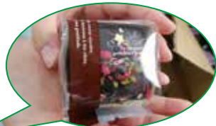
出来上がったスイーツは利用者に大好評でした