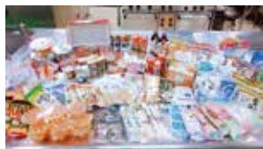
大会商品なども寄付しました