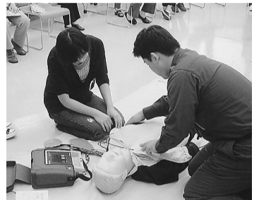
普通救命講習ではAED(自動体外式除細動器)の使い方も学びます。

核家族化などにより、子育てに対する不安があっても身近に相談できる人がいないため、孤立感を持つ方も多くなっています。また、2人目、3人目が欲しいけれど、なかなかふみきれないという声も聞きます。このような時に、身近な地域で、親身になって子どもと関わってくれる人がいると、どんなに安心できるでしょうか。