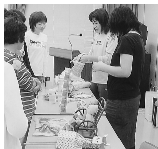
遊びの大切さを手作りのおもちゃをとおして学びます。

現在、その育児支援ができる方(サポート会員)が不足しております。ぜひ、サポート会員に登録してください。1時間につき、800円の謝礼が利用者から支払われます。