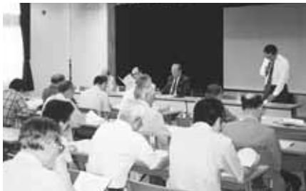
南綾瀬地区福祉協力委員会

社協の福祉活動や事業を地域住民主体ですすめるための『福祉協力委員会』が、この6月か