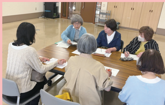
活動先の相談をしています

2024年3月、かつしかボランティア・地域貢献活動センターに「傾聴ボランティアの会 さわやか」の登録をいたしました。もともと、葛飾区で行っている傾聴ボランティアの活動を22年間続けていたこともあり、かつしかボランティア・地域貢献活動センターの職員から、「傾聴ボランティアの養成講座」に協力をいただけないかと相談をいただきました。養成講座後に、受講生の受け入れ先が必要だったので、急ぎボランティアグループとしての登録を行いました。