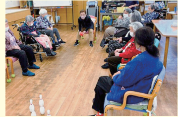
利用者さんと一緒に ボーリングをやる様子

活動で楽しいと感じる部分についてお聞きしたところ、利用者の方々は、ほとんどの方が自分よりも長い人生を歩んできているということもあって、それぞれの人生経験のお話をたくさん聞けるところがとても楽しいそうです。また、ご自身も一緒にレクリエーションへ参加して、“皆さんと一緒に” “楽しく運動ができることで、輪の中に自分がいることを実感できる事がとてもありがたいそうです。まだ活動を始めて数ヶ月でも、この活動を通して新しい居場所を見つけられたことがとても嬉しいそうです。社協としても、ぜひ今後とも活動を続けていってほしいと思います！