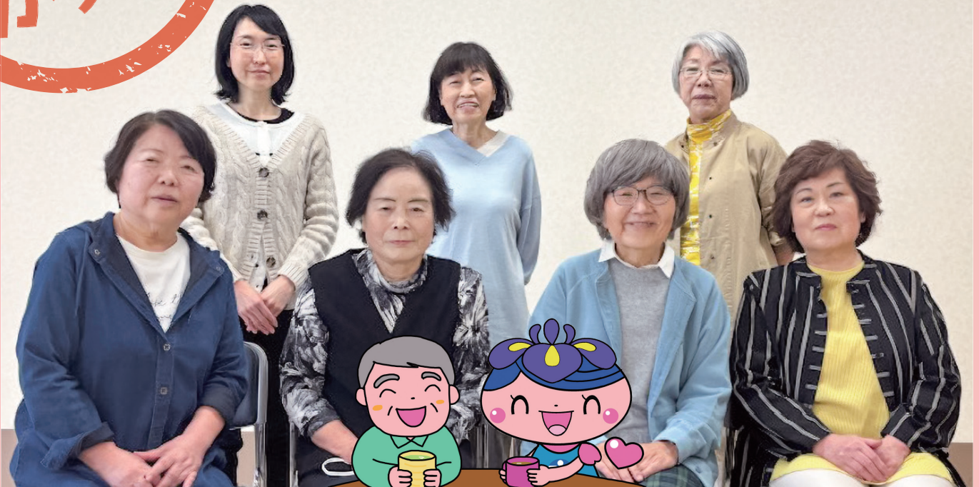
はじめての打合せです