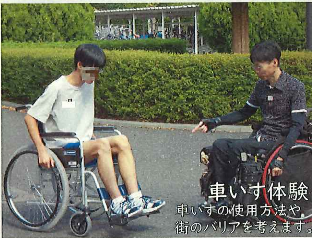
車いす体験 車いすの使用方法や、街のバリアを考えます。