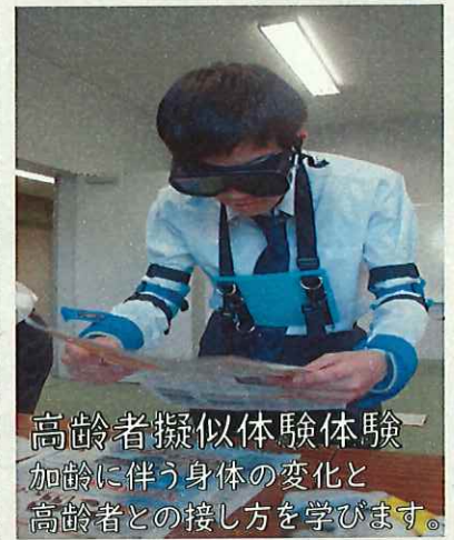
高齢者擬似体験体験 加齢に伴う身体の変化と高齢者との接し方を学びます。