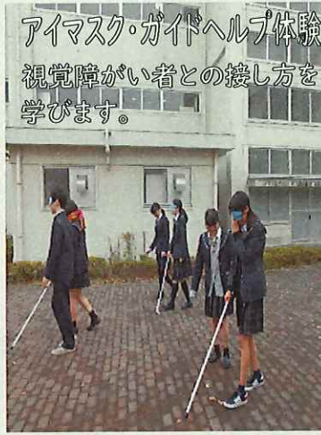
アイマスク・ガイドヘルプ体験 視覚障がい者との接し方を学びます。