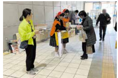
学生ボランティアによる募金活動

※新型コロナウイルス感染症の拡大防止の観点から、内容の変更や中止となる場合がございます。ご了承ください。