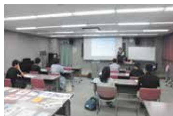
災害ボランティアについて