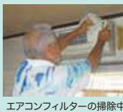
エアコンフィルターの掃除中