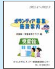
児童館・学童保育クラブ