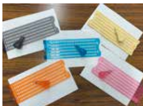
点訳作業に必要な点字器と点筆