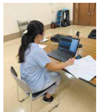
「オンライン専門相談」