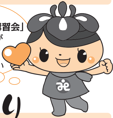
社協キャラクターのAエナちゃんです!