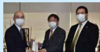
東京葛飾ライオンズクラブ(R3.12.28)