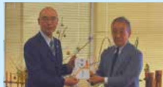
葛飾区商店街連合会(R3.12.23)