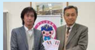
ドコモショップ亀有店 ドコモショップアリオ亀有店 ドコモショップ金町駅前店 auショップ金町店 (R3.12.27)