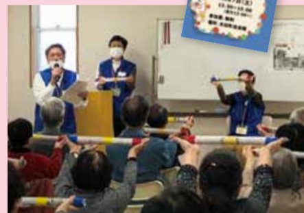
新聞紙で健康レク