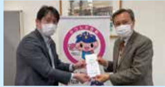
イトーヨーカドー労働組合亀有支部(R4.1.13)