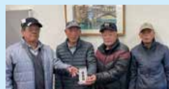
サンサンクラブグラウンドゴルフ部(R3.12.13)