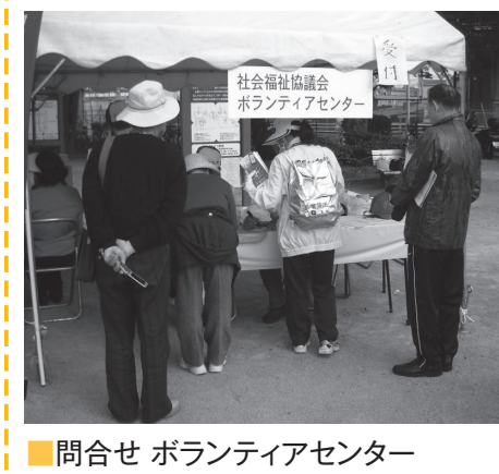
問合せ ボランティアセンター

社協と葛飾区は「災害時におけるボランティア活動等に関する協定」を結んでおり、区内で大災害が発生した場合、災害ボランティアセンターをウィメンズホールに立ち上げます。災害ボランティアセンターは、被災地でボランティア活動を行なうための拠点となります。主な機能は「支援を必要とする被災者の困りごと(「119」)に被災者のために役に立ちたいという思いのボランティアを結びつけることです。ボランティアの安全を第一に、自主性や柔軟性を生かし、創意工夫しながら、地域の復興・復興、そして地域住民の力を引き出すための被災者支援を行います。