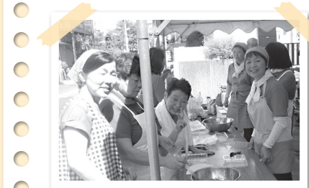
↑朝早くから、準備にとりかかる町会の皆さん。

毎年高齢者を招待し、奥戸しらすぎ集い交流館にて、式典や演奏会の開催、焼きそば、ポップコーンの出店などで賑わっています。