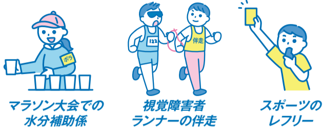
マラソン大会での水分補助係