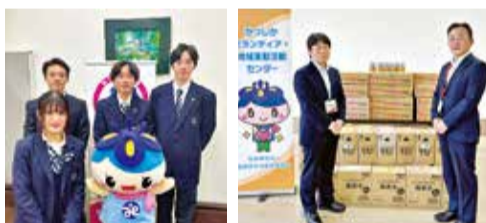
写真左:東京都立南葛飾高等学校生徒会(R7.11.26) 写真右:日産東京販売ホールディングス株式会社(R7.10.27)

社会福祉協議会への寄付や会費は、寄付金控除の対象です。個人の場合は確定申告により、所得税、住民税の控除が受けられ、法人の場合は損金の額に算入することが出来ます。控除方法については、管轄の税務署にお問い合わせください。