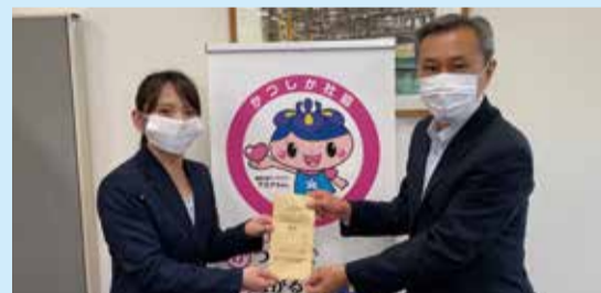
イトヨーカドー労働組合亀有駅前支部(3.9.7)

たくさんのおあたたかいお気持ちをありがとうございます。令和3年度も多くののお店や事業所にアエナちゃん募金箱を置いていただいています。