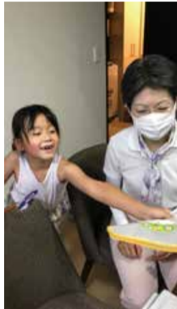
サポート会員さんとの 楽しい時間