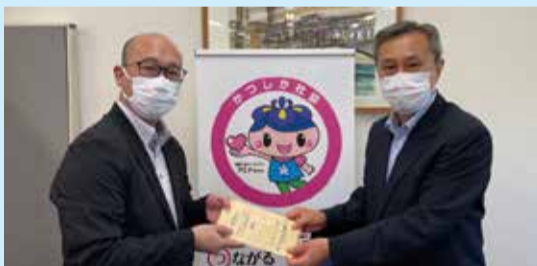
イトヨーカドー労働組合亀有支部(3.8.10)