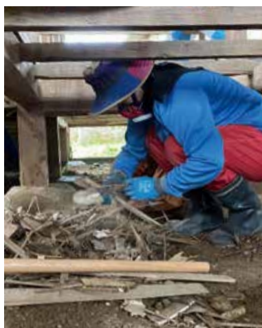
浸水や土砂災害のあった家での活動

令和3年7・8月の豪雨災害では、静岡県熱海市をはじめ日本各地で大きな被害がありました。コロナ禍の被災地では、現在住の多くのボランティアが、被災者を支援するために活動しています。 葛飾が被災したときに備え、活動の中心となるボランティアが必要です。皆さんも、災害ボランティアに登録して社協とともに活動してください！ ●登録者には ボランティア保険加入の際、補助があります。 「登録手続」窓口までお越しください。 「申込み・問合せ」 ボランティア・地域貢献活動センター ☎03-5698-2511