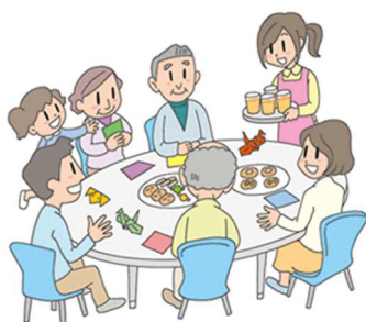
ふれあいサロン活動