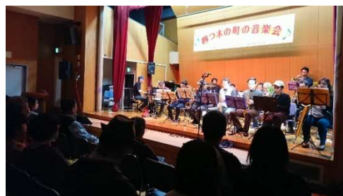
音 楽 会