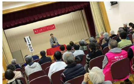
落 語 会