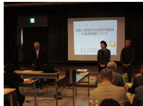
明第二西地区社協の方々