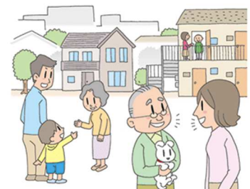
見守り声かけ活動