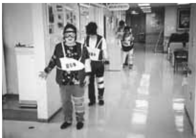
高齢者疑似体験のようす