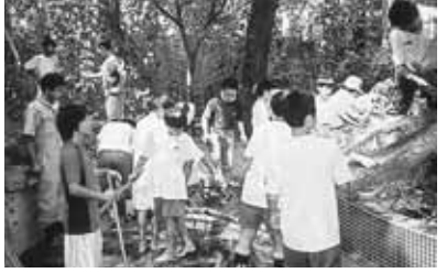
生徒と父親が協力した小松池の清掃

校内では、「自分の足跡を残そう。」という呼びかけに応じ、小松池の清掃や花壇・水飲み場のペイントなどに、父親委員会のお父さんと活動しています。道行く人が、「ご苦労さま、ありがとうね。」とねぎらいの言葉をかけてくださることが、参加した生徒へのご褒美です。