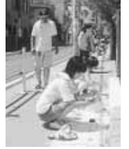
花壇のペイント風景

小松中学校の生徒は「地域と私」を縦軸にして、1年生「地域を知る＝わが町マップをつくらう」、2年生「地域で体験する＝職場体験」、3年生「地域に貢献する＝ボランティア活動」を総合的な学習の時間で取り組んでいます。3年生は9月～11月に7回ほど地域に出て活動します。