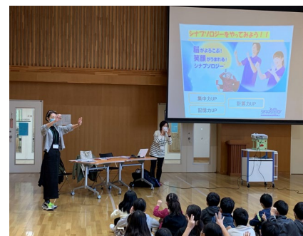
〔中青戸小：シブソロジー-認知症講座〕