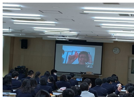
〔南葛高校：知的障がいについて〕 (オンライン講座)