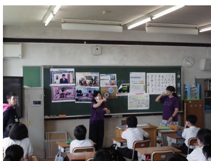
〔堀切中：手話体験学習〕