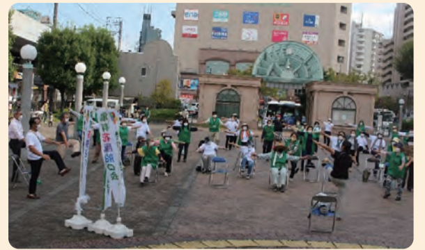
屋外での健康体操