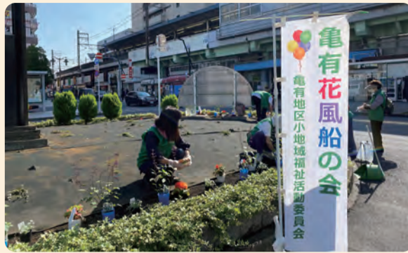
北口花壇の植え付け