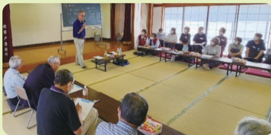
【青戸地区：青戸の歴史・文化を考える集い】