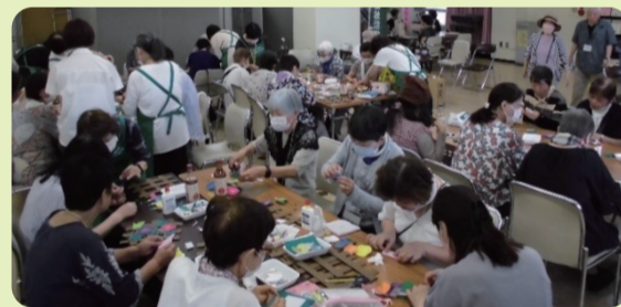
【金町地区：お茶のみ会(小物づくり)】