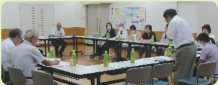
【新小岩北地区：委員会】