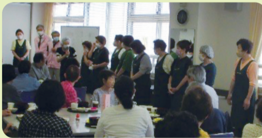
【新小岩地区：食事会】