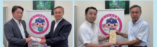
双葉ライン(R6.7.4) イトーヨーカドー労働組合亀有支部(R6.8.13)