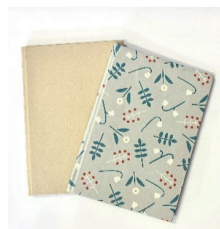
ハードカバー製本(見本)