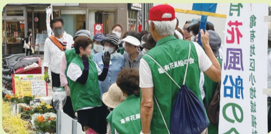
【亀有地区：花壇づくり】