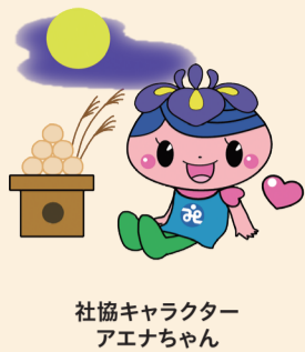
社協キャラクター アエナちゃん