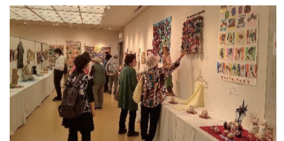
昨年度のアートフェアの様子

【申込方法】 10月17日(木)までに、電話またはQRコードでお申し込みください。