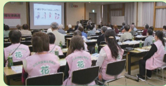
【お花茶屋地区：健康講話】