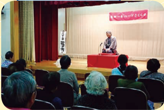
【東四つ木地区・落語会】