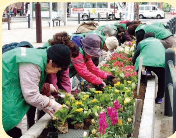
【亀有地区：花壇づくり】