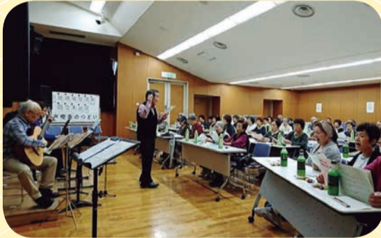
【四つ木地区：歌声喫茶】