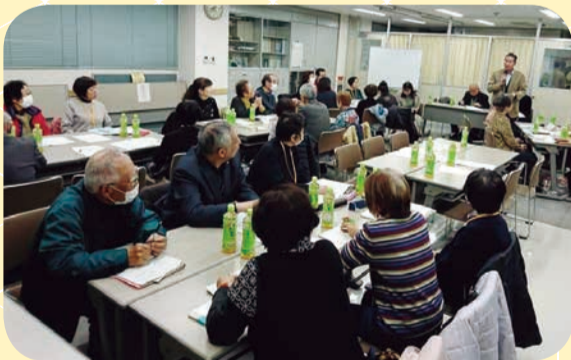
【東立石地区：委員会】

地域共生社会の実現に向けた小地域福祉活動の3つの場づくり 小地域福祉活動を進めるにあたり、地域の皆さんに馴染みのある19の地区(連 合町会・民児協)を活動単位として、「皆で地域を知る場」、「地域の皆が知り合 う場」、「地域の皆で活動する場」の3つの場づくりに取り組んでいます。