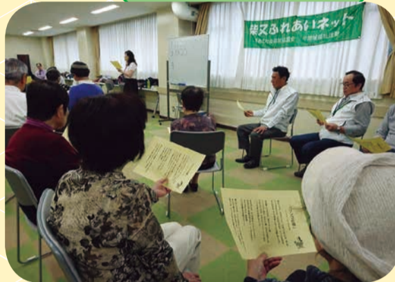
【柴又地区：イベント】