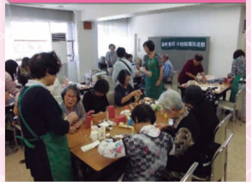
金町地区サロン会(お茶飲み会)