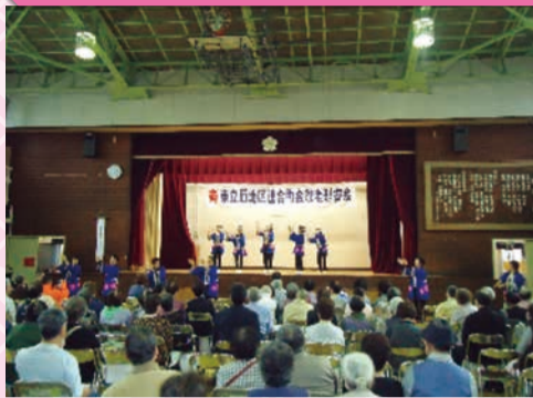
東立石地区連合町会 敬老慰安会