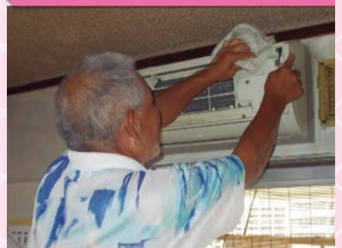
ボランティア派遣(エアコンの掃除)