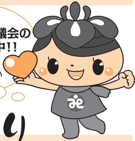
社協キャラクターのアエナちゃんです!