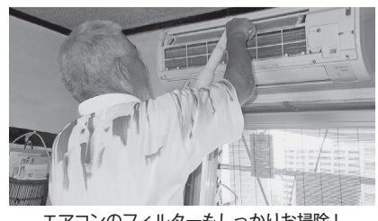
エアコンのフィルターもしっかりお掃除!

問合せ ボランティアセンター 高齢者や障がいのある方などが、蛍光灯の交換や小さな家具の移動など、ちょっとした困りごとがあったときに地域のボランティアがお手伝いをするサービスです。