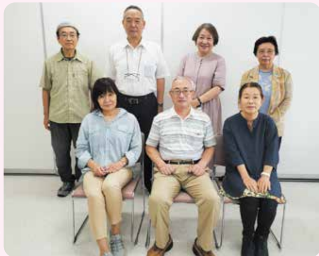
かつしか市民後見センターの活動メンバー