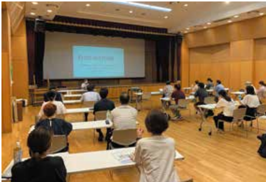
たくさんの方が来てくれました