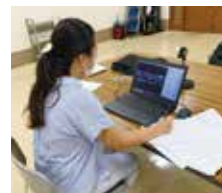
オンラインで相談