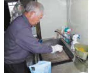
フィルター掃除中