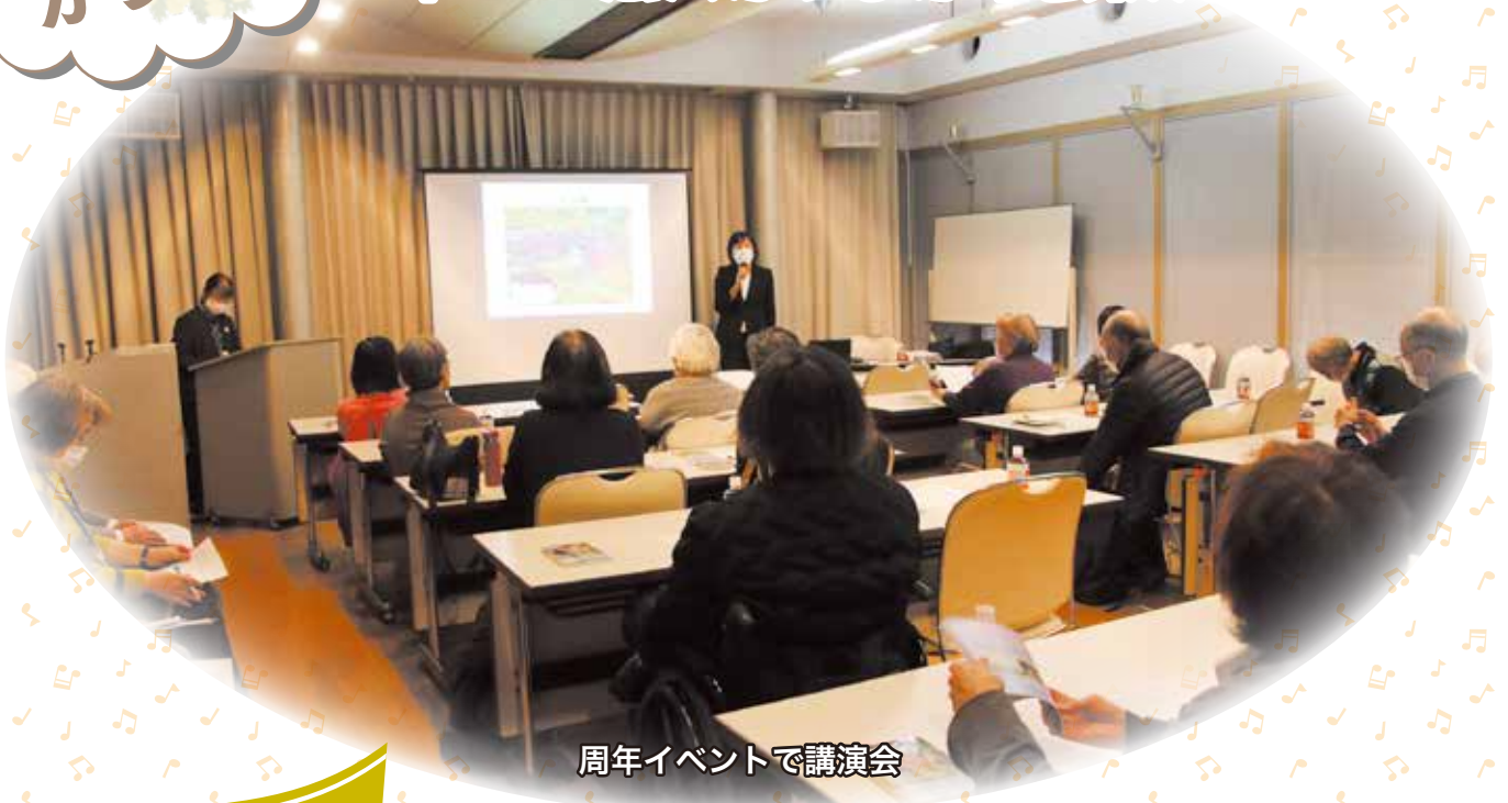
周年イベントで講演会