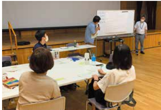
グループワークの発表