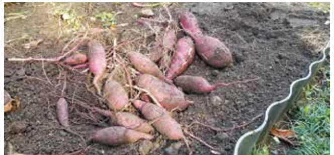
たくさん収穫できました