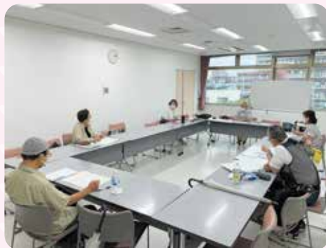
月に1回の定例会議