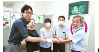
写真3:グラウンドゴルフ サンサンクラブ(R7.9.29)