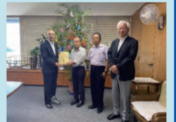
葛飾区観光協会鎌倉支部 (R5.6.29)