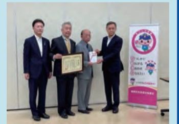
ひがしんビジネスクラブ オーロラ(R5.5.26)