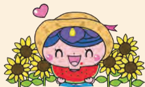
社協キャラクター アエナちゃん