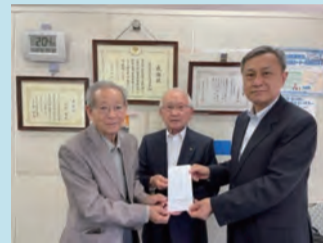
東立石さくらまつり 実行委員会(R5.5.22)