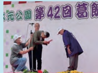
水元公園葛飾菖蒲まつり 実行委員会(R5.6.18)