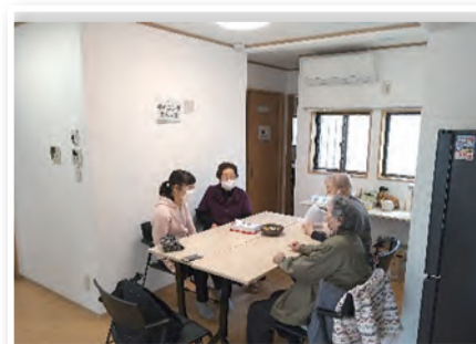
おしゃべりの様子