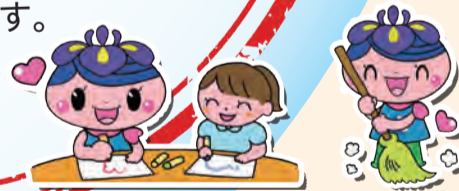
ファミリー・サポート・センター しあわせサービス

また、支えあいや助けあい活動については、迅速かつ確実に利用者と協力者をつなぐとともに、SNSなどを積極的に活用し、区民への情報提供を図ります。