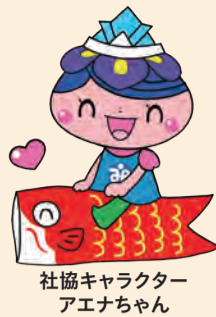
社協キャラクター アエナちゃん