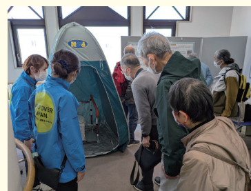
NPO 法人 HandOverJapan