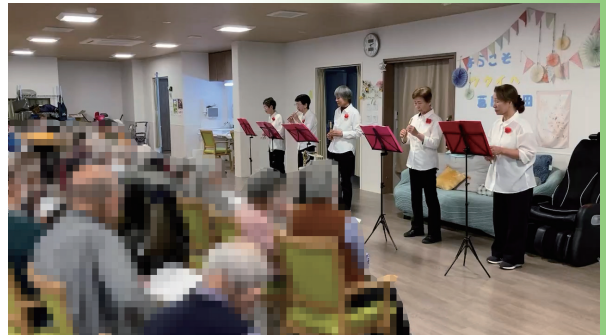
デイサービスでの演奏の様子 二次元コードからご覧ください▶

10年以上にわたり地域で活動を続けてこられた皆さん。活動日には、よし笛のやさしい音色が館内に響き、とても印象的でした。これからも新しいメンバーが加わり、活動の輪が広がっていくことを願っています。誌面だけでは伝えきれない魅力がありますので、ぜひ掲載している動画もご覧ください。(熊手)