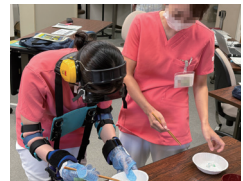
都立東部地域病院 「高齢者疑似体験講座」