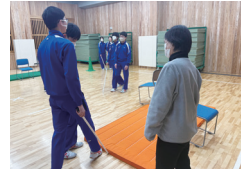
葛飾区立小松中学校 「アイマスク・ガイドヘルプ体験講座」