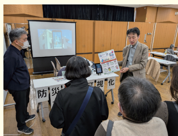
ア!安全快適街づくり

当日は、3つのNPO団体にご協力をいただき、NPO法人ア!安全快適街づくりによる「防災情報可視化アプリ『天才!まなぶくん葛飾』の体験」をはじめ、NPO法人さんばはうす葛飾による「乳幼児のいる家庭の防災対策」、NPO法人Hand Over Japanによる「パネルによる活動紹介」などを実施しました。