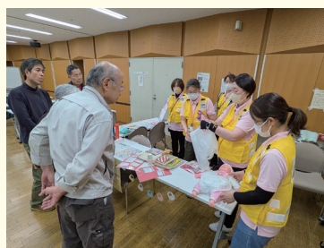
NPO 法人さんばはうす葛飾