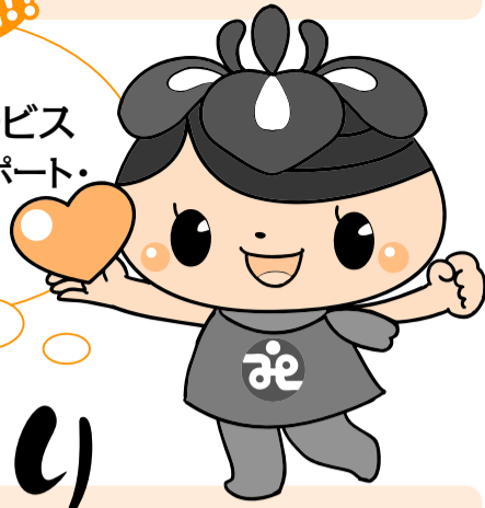
社協キャラクターのAエナちゃんです!