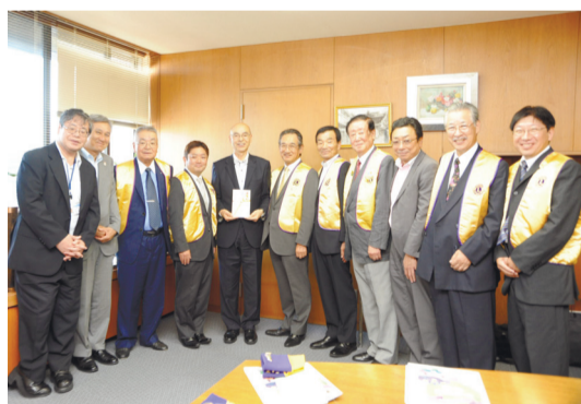
東京葛飾ライオンズクラブ (27.10.6)