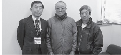
浅江公園グラウンド・ゴルフ健寿会 (1・26)