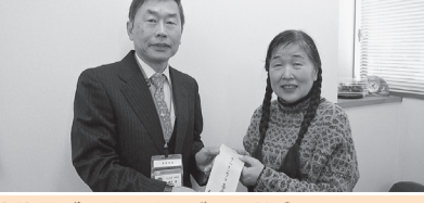
葛飾区グラウンド・ゴルフ協会 (2・10)