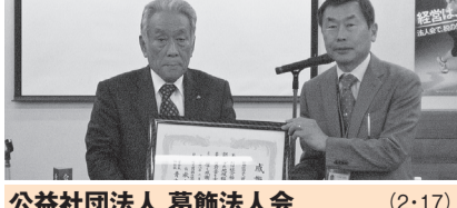
公益社団法人 葛飾法人会 (2・17) 平成27年11月の寄付に対して感謝状贈呈