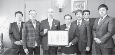
日本大学校友会葛飾桜門会 (1・19)