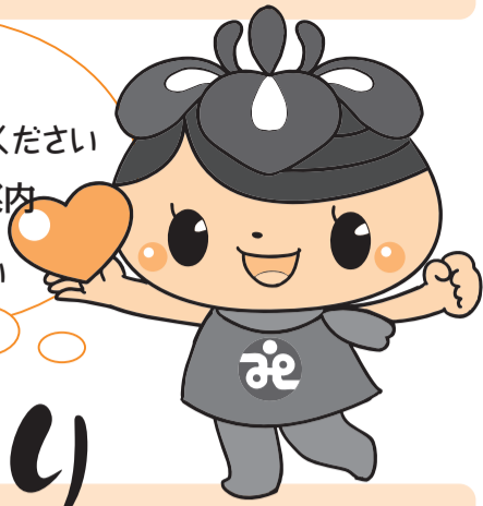
社協キャラクターの「アエナ」ちゃんです!