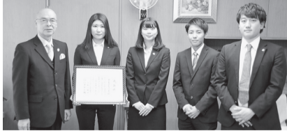
東京聖栄大学学友会 (2・9)