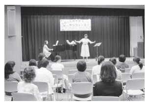
6月25日開催の交流会ではカンツォーネを楽しみました