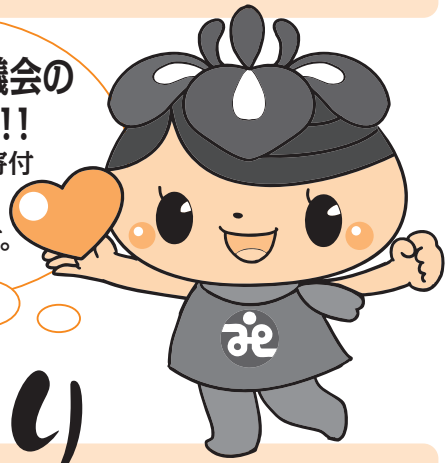
社協キャラクターのAエナちゃんです!

社会福祉協議会の 会員募集中!! 皆様からの会費や寄付 は、地域の福祉事業 に活用されます。