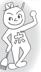
かつしか ボランティアまつり キャラクター 「ボラくん」