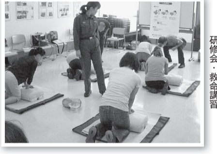
研修会・救命講習

子育てサポーター 1時間800円で地域の子育て支援のお手伝い「かつしかファミリー・サポートセンター」サポーター会員募集中