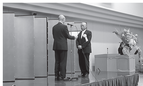
かつしか異業種交流会 30周年記念式典にて 葛飾遊技場組合 感謝状贈呈 (29.9.5)