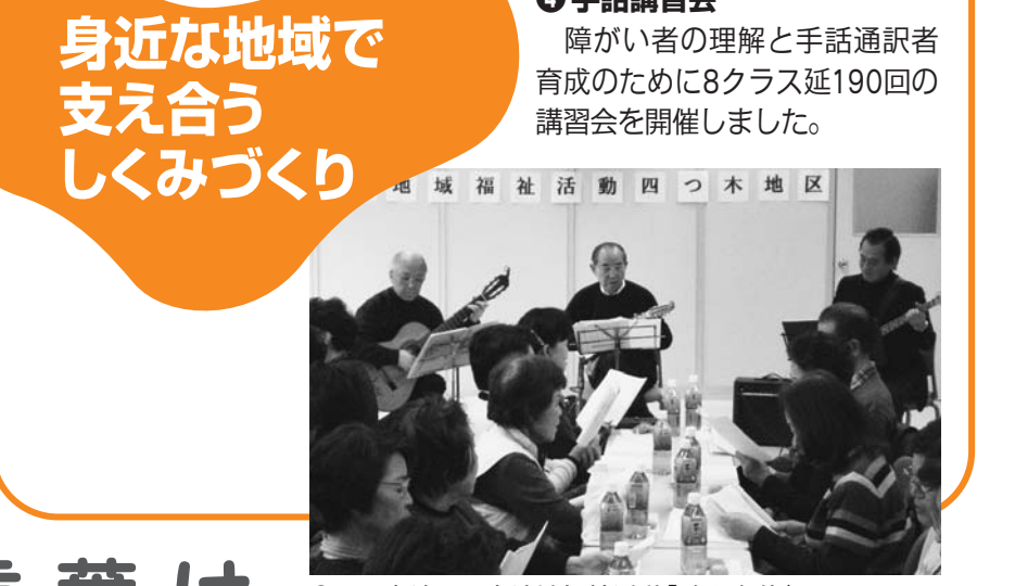
○四つ木地区の小地域福祉活動「歌声喫茶」