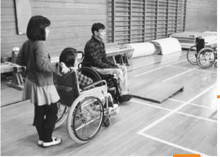
○小学校での車いす体験のボランティア出前講座