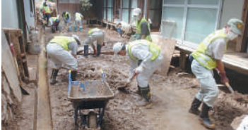
災害ボランティアによる泥出し活動

登録者には ボランティア保険の補助があります。 災害ボランティアアマンニユアルや訓練などの情報を提供します。 登録手続 窓口までお越しください。