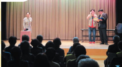
青戸地区 振り込め詐欺防止の寸劇