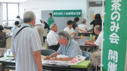
金町地区 お茶のみ会