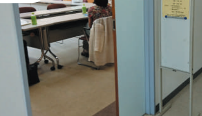
四つ木地区 困りごと相談