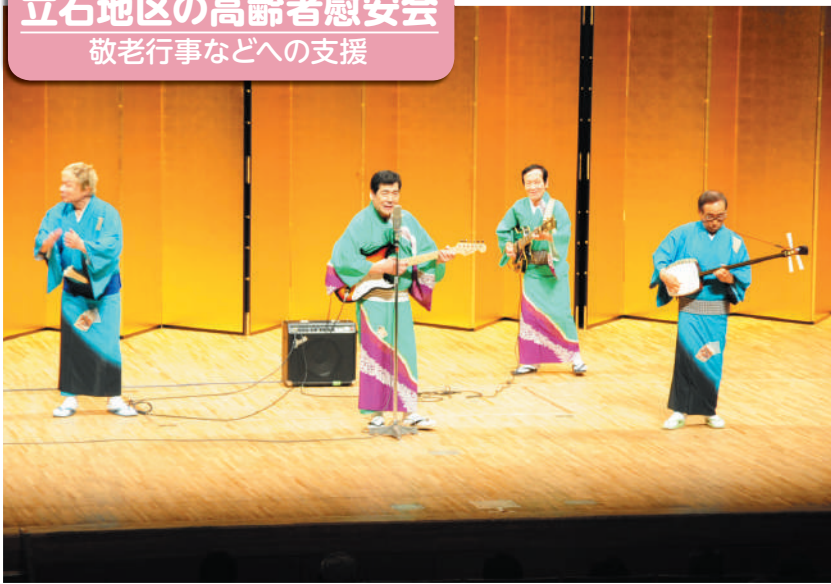
立石地区の高齢者慰安会 敬老行事などへの支援