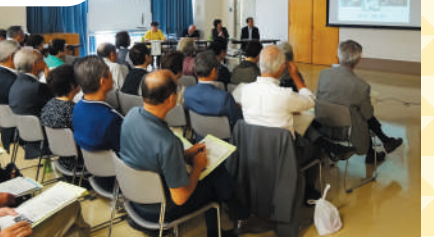
全体の情報交換の場