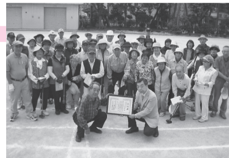
サンサンクラブグラウンドゴルフ部 (25.5.26) 会員の皆さんからの募金を葛飾の福祉に役立ててほしいと寄附していただきました。