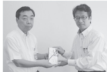
イトーヨーカドー常磐南ブロック (25.8.30) 常磐南ブロック支部に所属する組合員の皆さまから、葛飾の福祉に役立ててほしいと寄附していただきました。