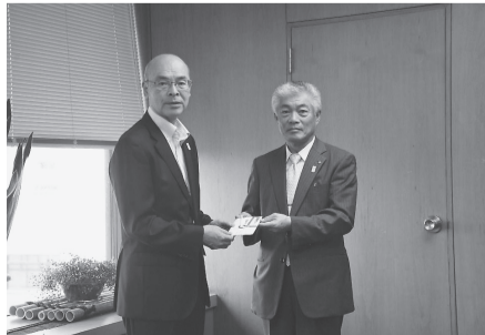
双葉ライン株式会社 (25.7.19) 社内で開催したチャリティゴルフ大会での募金を地域福祉のために寄附していただきました。