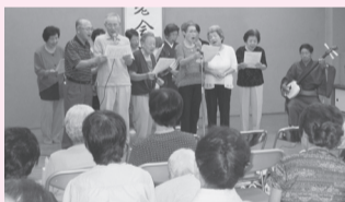
奥戸町会主催(奥戸地区町会連合会) 敬老会での合唱!!

高齢者の長寿を祝い、地域のつながりや高齢者同士の交流によって、高齢者が住み慣れた地域で生き生きと暮らすための活動に助成しています。