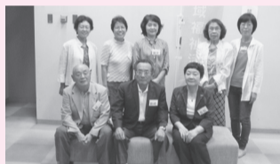
(四つ木地区「困りごと相談」の相談員) みなさんの相談、待っています!!

地域の皆さんが中心となって、地域全体で支えあう仕組みを築き、地域での困り事や心配ごとなどの解決に向けた取り組みを行っています。