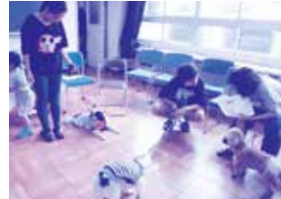
保護してお世話してきた方から保護された事情・性格などを聞きます

「昨年も参加し、今回2回目の参加です。映像の中で、前回担当した犬が今は新しい里親のもとで幸せに暮らしていると知って、ほっとしました。」「一匹ずつに個性があってかわいらしい。日本の殺処分ゼロを強く願います。」などの感想があり、命の大切さを感じた一日となったようです。