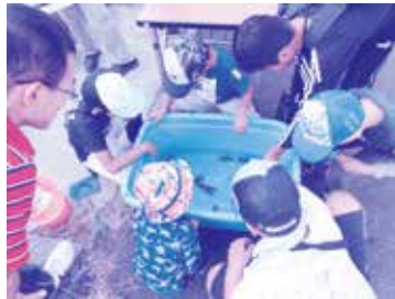
みんなで成果を確認します