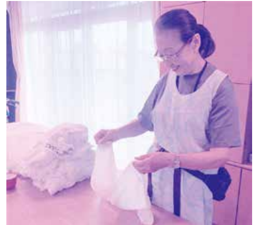
おしほりたたみの活動中