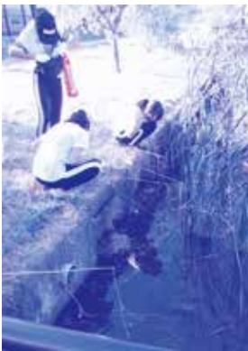
ここはザリガニ密集地帯でした