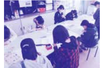
保護犬が再び迷い犬にならないように、迷子札を作成します