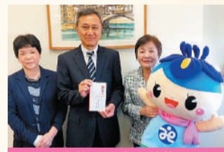
家庭倫理の会 葛飾区 (1.11.8)