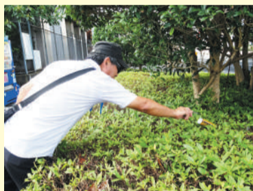
ごみ拾いも身近なボランティア活動