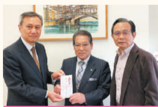
葛飾明るい社会づくりの会 (1.11.13)