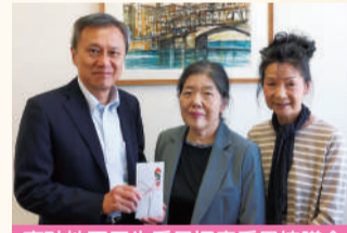
高砂地区民生委員児童委員協議会 (1.10.9)