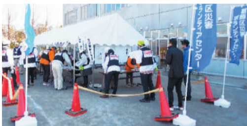
災害ボランティアセンター設置・運営訓練

◆ 募集 万が一に備えて! 災害ボランティアセンターの設置・運営訓練 ◆ 日時 令和2年3月14日(土) 午後2時~4時 ◆ 会場 ウェルピアかつしか ◆ 定員 50名(多数抽選) ◆ 内容 災害ボランティアとして、受付から活動までの流れを体験 ◆ 申込方法 3月9日(月)までに、電話・FAX・QRコードでお申込みください。