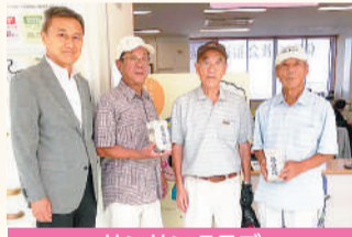
サンサンクラブ グラウンドゴルフ部 (1.9.27)