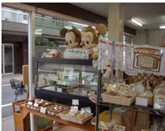
取材：金成由紀子実習生 (明治学院大学)

7月1日、自主生産品販売所「+Choice ぷらすちよいす」が青砥駅近くにオープンしました！葛飾区と区内の知的障害のある方が通う13の施設が協力して運営し、パンや洋菓子、せんべい、ハーブティー、花たわし、ビーズ製品、陶芸品など、それぞれの施設が生産しているさまざまな商品が売られています。カフェコーナーでは、コーヒーやカフェオレを飲みながら、お店で購入した商品を食べることができ、さらには、 本格的なカレー をサラダとセットで食べることもできます。3種類あるカレーは、お客様からの評判も上々で、取材中もとってもいい匂いがしました。