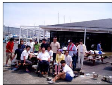
<マリーナでのバーベキュー>