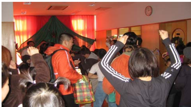
リノブス、ノブス、実行委員会の ユニバーサルディスコ会場 おはらぎから、ノノノです。

今回初のイベント、ユニバーサルディスコも盛況でした。初めは遠巻きで見物していた人も、曲にあわせてステップを教えてもらって、楽しく踊っていました。