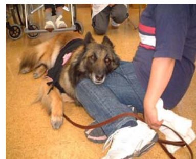
<膝枕をしている芸です>