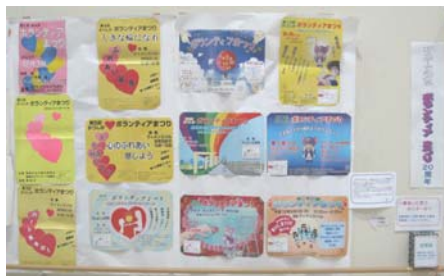
第7回、12回、15回 のポスター 人気投票