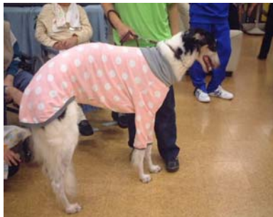
<大きいボルゾイです>