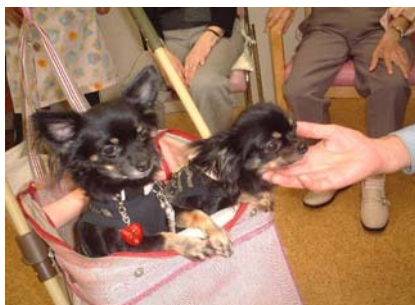
<ちっこいチワワちゃんです>