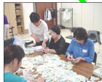
<使用済み切手の回収>

現在、通常切手(鳥の図柄)を引き取ってくれる古物業者がみつからないため、できれば記念切手を中心に、引き続き使用済み切手の収集にご協力をお願いします。