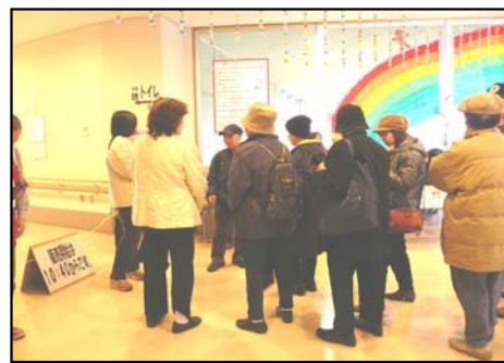
まだかなあ みんなの 10分が ほしい

また、ボランティアまつり20周年を記念して、20枚のポスターを展示し、人気投票をしました。結果は、第7回・12回・15回が同票でした。いずれも手書きのイメージのものでした。(実行委員反省会で決戦投票?を行なり予定です。)