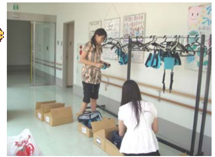
<疑似体験セットの整理>

かつしかボランティアセンターでは、毎月15日に発行される「センターだより」の発送や、小中学校での疑似体験セットの整理、ボランティアに関する様々な資料を整理したりといった体験をしました。