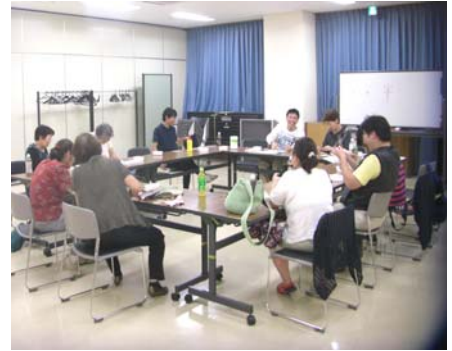
<和気あいあい？ 大騒ぎ前>

9月8日(火)午後6時半から、今年度の「ボランティアのたまり場」として5円玉で亀のストラップを作りました。参加者は12名。講師はVネット役員。