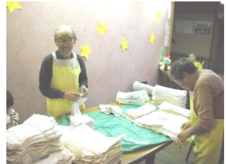
＜すずうらホームでのおしぼりたみ＞