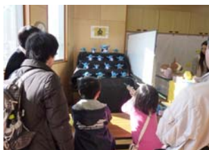
<ミニ縁日 吹き矢ゲーム>