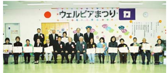
<開会式で表彰された方々>

式典終了後、屋外開放広場にテントを連ねた10の模擬店が食べ物や草花を、2階のバザー会場では、15団体がお菓子や自主製品、雑貨などの販売を開始。また毎年このお祭りに協力いただいている栃木県茂木町の皆さんが、広場に所狭しと並べた産直の農産物や食料品などの販売にも多くの方々が見物しました。