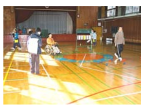
<ポッチャゲーム体験>