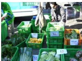
<茂木町の新鮮野菜>