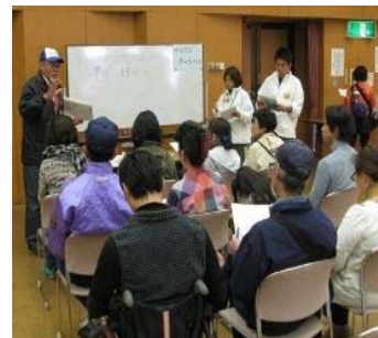
災害ボランティアセンター 立上げ運営訓練の様子

※①から④-1までの内容のふりかえりとして、皆さんに「災害時にどのような活動ができるのか」を考えていただき、災害ボランティア・災害ボランティアグループへの登録のご案内をします。