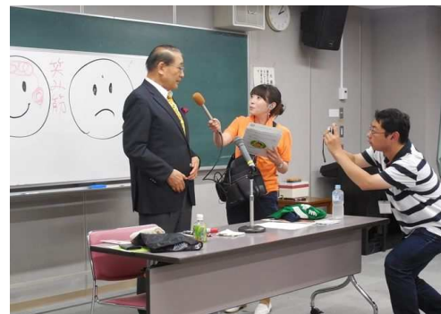
昨年はかつしかFMの取材を受けました

申込方法：電話またはFAX(「ボランティア学」、 住所、氏名、電話番号を記入)にて お申込ください。先着順に受け付け、 定員になり次第締め切ります。 ※3歳以上のお子さんの保育も行います。 (各日10名まで)