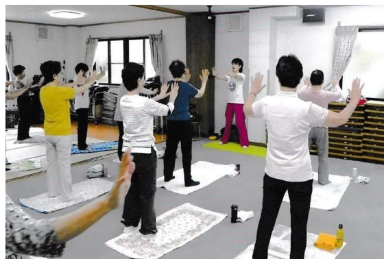
高齢者の転倒予防・体力づくりを目的に、講師を招いて筋力トレーニング教室を開催—金町マンション「みまもり・あんしんの会」

A区分：団体によるニュースの発行 10周年の記念誌を発行し、傾聴ボランティアについての周知を図る。