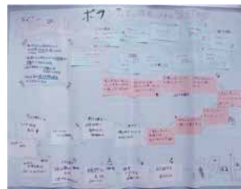
ワークで作成したスゴロク

最後に、「またボランティア活動してみたい？」の質問には、「すでに次の活動を約束してきた」や「グループ内の人が行った施設に興味がある」といった答えが返ってきて、ぜひ今後の活動につなげてほしいと思いました。