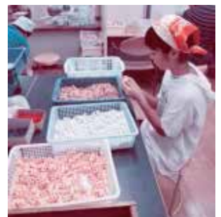
障がい者施設での実践体験

ボランティアセンターだよりは、区内各駅ほか各配布協力先にも設置していただいております。配布協力先の詳しい情報はホームページをご覧ください。http://vc.katsushika-shakyo.com/